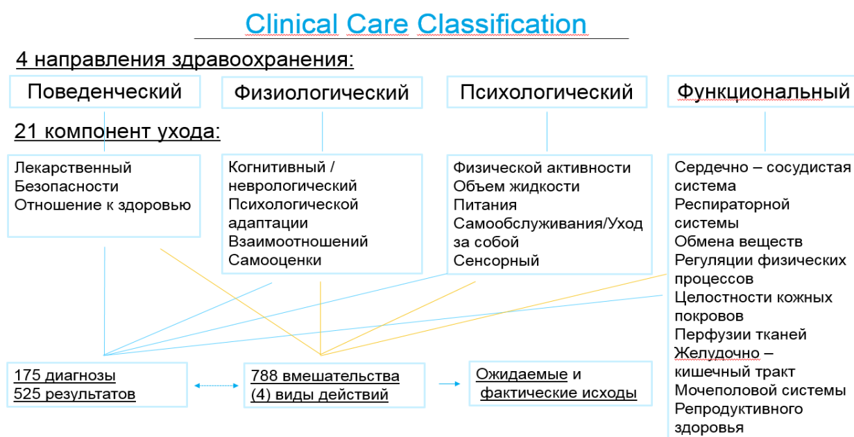
Рисунок 1. Четыре направления здравоохранения и 21 компонент ухода системы CCC.

Каждое направление представляет отдельный набор компонентов ухода. Второй уровень состоит из 21 компонента ухода, которые охватывают четыре направления здравоохранения. Третий уровень состоит из: 175 сестринских диагнозов, представляющих конкретные проблемы пациентов, и 788 сестринских вмешательств и действий по уходу (197 вмешательств, каждый из которых имеет один из 4 типов действий (оценка, выполнение вмешательства, обучение и ведение пациента)). Четвертый уровень представлен ожидаемыми и фактическими исходами 175 диагнозов. Ожидаемые исходы включают: улучшить состояние пациента; стабилизировать состояние пациента; поддерживать ухудшающееся состояние пациента. Фактические исходы включают: состояние пациента улучшено; состояние пациента стабилизировано; состояние пациента ухудшено или смерть (Рисунок 1) [2, 3].